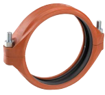
Größen 14 – 24"/DN350 – DN600 Patentiert