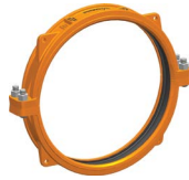
Größen 26 – 50"/DN650 – DN1250 Patentiert