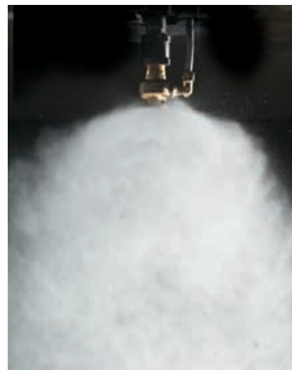
PATENT 7 686 093 - BRANDBEKÄMPFUNGSSYSTEM MIT DOPPELTER LÖSCHWIRKUNG DURCH AUSWÜRFE MIT HOHER GESCHWINDIGKEIT UND NIEDRIGEM DRUCK. AUSLÄNDISCHE PATENTE EBENFALLS ANGEMELDET UND GEWÄHRT.

Dank der speziell entwickelten Überschalltechnologie wird das Wasser vom System auf <10 \mu\text{m} zerstäubt und bildet eine dichte, homogene Suspension von Stickstoff und Wasser. So laufen zwei Lösmechanismen gleichzeitig ab: Kühlung und Reduzierung des Sauerstoffs.